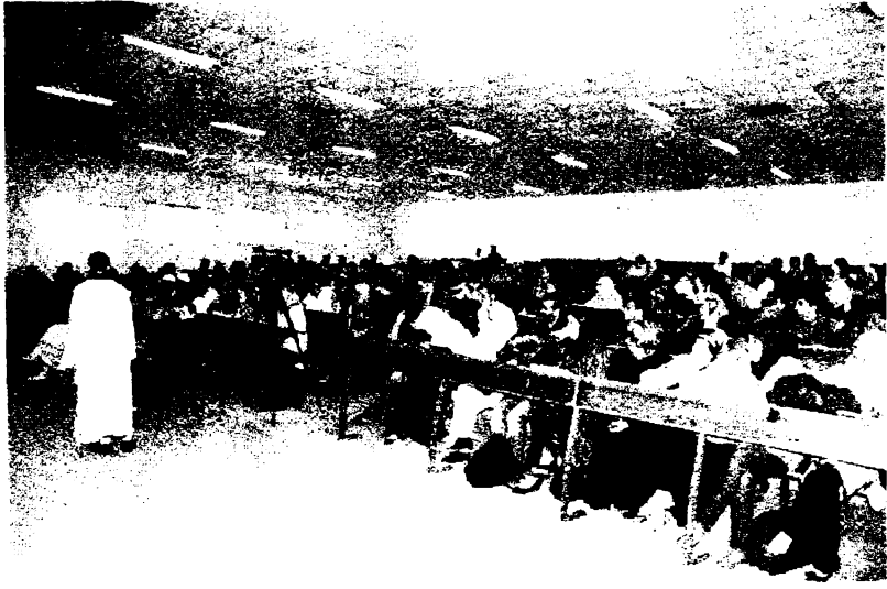
صورة من جانب آخر للحضور الكريم